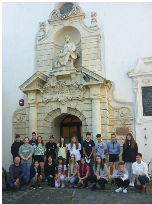
Nagyszalontán a Csonkatoronynál

4 órakor indultunk Jászszentlászlóról. A határetkelés után Nagyszalontára mentünk, első úti célunkhoz. Megtekintettük a Csonkatornyot és Arany János szükőházát. A tanulóknak tetszettek az interaktív ismertető platformok. Tanulói kiselőadás formájában elevenítettük fel a költő életrajzát. Majd részlet csendült fel Toldi című elbeszélő költeményből. Megemlékeztünk arról is, hogy Petőfi több hetet töltött el együtt az Arany-családdal. Tanulói szavalat hangzott el: Petőfi Sándor: Arany Lacinak. A diákok koszorút helyeztek el az emlékház falán. Nagyváradon a székesegyházat tekintettük meg, majd egy diák felevenítette Szent László életrajzát, ezután megkoszorúzták Szent László szobrát. Sétáltunk a Petőfi Sándor parkban. Egy diák ismertette Petőfi Sándor életrajzát. Ezután Vársonkolyosra utaztunk, ahol a Nagy Magyar-barlangot tekintettük meg. Csucsán meglátogattuk az Ady-emlékházat. Tanulói kiselőadás formájában ismerkedtünk meg Ady Endre életével. Az Őrizem a szemed című vers tanári előadása következett, majd koszorút helyeztünk el a ház falán. Ezt követően Magyarfenesen elfoglaltuk a szállásunkat, ahol a tanulók útinaplót írtak.