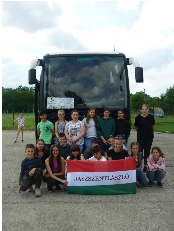
Indulás előtt ...