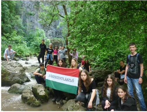
Túra a Tardai-hasadékban