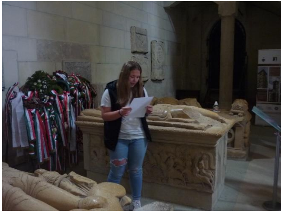
Hunyadi János síremlékénél Gyulafehérváron

Alvincről a közeli Gyulafehérvárra mentünk, a Szent Mihály-székesegyház megtekintését követően Hunyadi János sírját koszorúztuk meg, és a székesegyház történetét is megismerhettük tanulói kiselőadásban. Utunk Vajdahunyadra vezetett. A vár történetét egy tanuló ismertette, majd Hunyadi János életpályáját is felidéztük. Ezután Dévára mentünk, sajnos a várba nem tudtunk bejutni, mert a felvonó szerkezet és kiszolgáló épületek feljítása zajlik ezekben a hónapokban. A vár építésének történetét tanulói kiselőadás formájában hallhattuk, majd a Kőműves Kelemen című népballada tanulói felolvasása következett. Utolsó erdélyi úti célunk Arad volt. A vértanúk emlékművét koszorúztuk meg, előtte tanulói kiselőadás formájában az 1848-49-es szabadságharc történetének vázlatát hallgathattuk meg, majd a vértanúk életrajzát ismertette három tanuló. Ezt követően indultunk haza, Jászszentlászlóra.