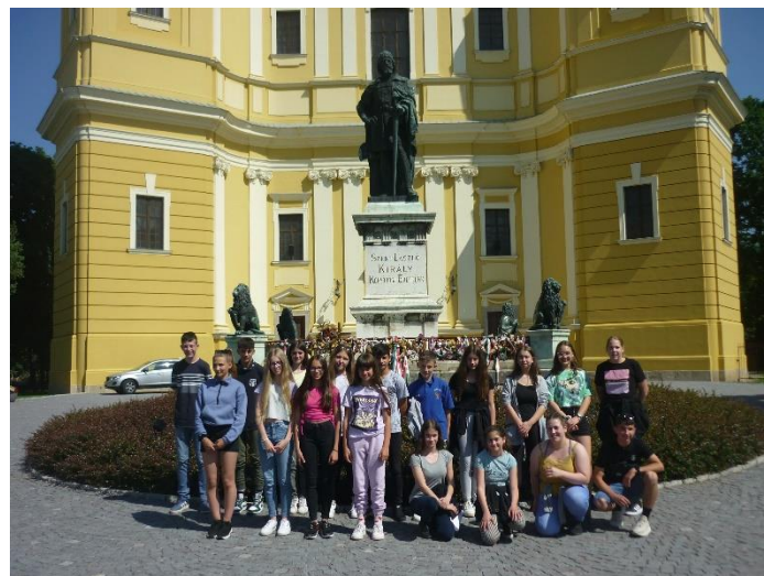
Nagyváradon a Szent László szobornál