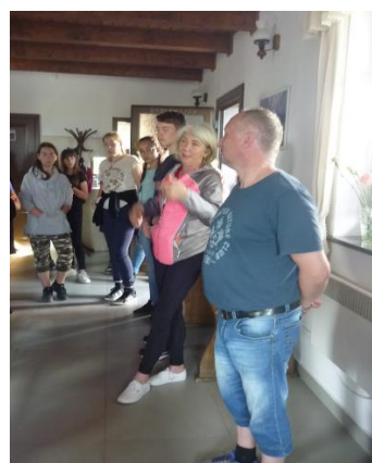
Előadás a gyermekotthon vendégházában