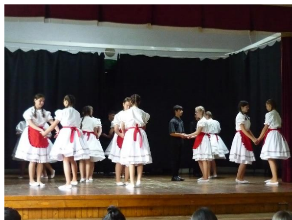
Tánc a Nemzeti Összetartozás Napján