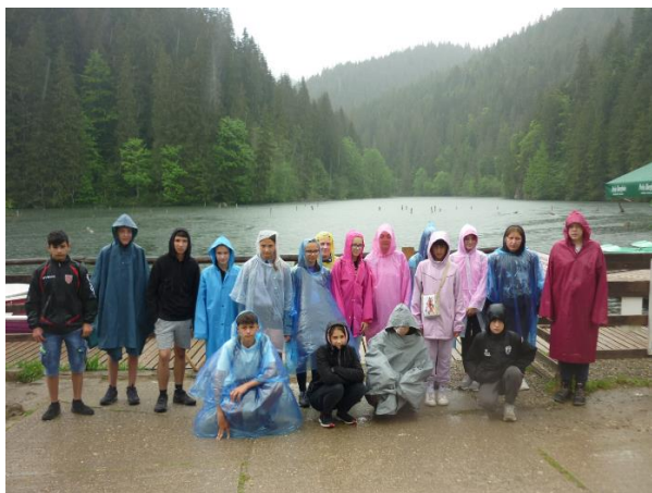
Esőben a Gyilkos-tónál