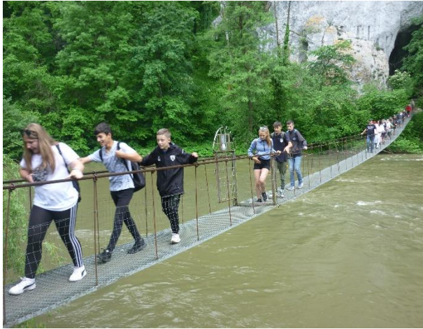
Vársonkolyoson a függőhídon