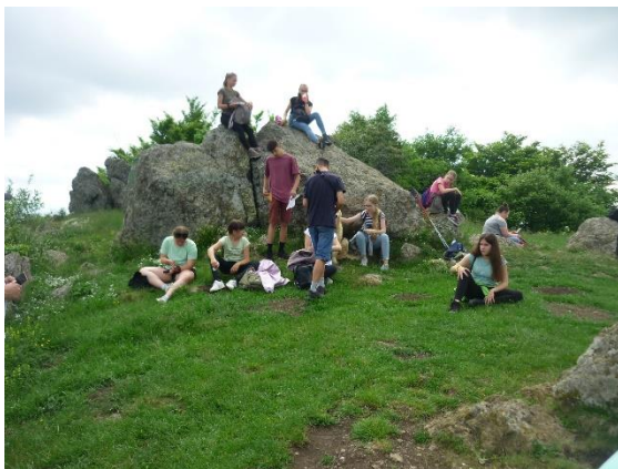
A Székelykő tetején

A délelőtt folyamán a Székelykőre túráztunk, az egész program körülbelül 6 órára sikerült. A fenti pihenő után következett a neheze, mert a túra utolsó két órájában már esett az eső, ami nehezítette a lejutásunkat a hegyről. Egy kis pihenő és az ebéd elfogyasztása után délután a tövisi ortodox női kolostorhoz mentünk. A tanulók egy kis betekintést nyerhettek az ortodox kereszténység titkaiba. A kolostor megtekintése után és egy rövid gyalogtúrát tettünk a remetei sziklaszorosban. Visszaúton Nagyenyeden a Bethlen Kollégiumot kerestük fel. Tanulói kiselőadást hallgathattunk meg a kolostor történetéről és az intézmény névadójáról Bethlen Gáborról, majd megkoszorúztuk a legnagyobb erdélyi fejdelem szobrát. Torockón, a szálláson naplórás következett.