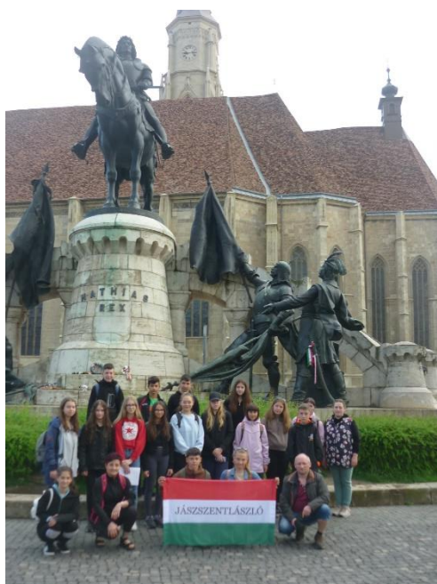
Mátyás király szobránál