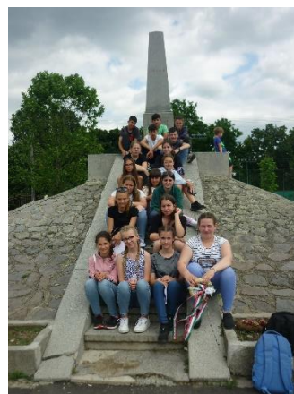
Az aradi hősök emlékművénél