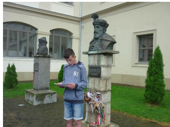
Előadás Bethlen Gábor szobránál a Nagyenyedi Kollégium udvarán