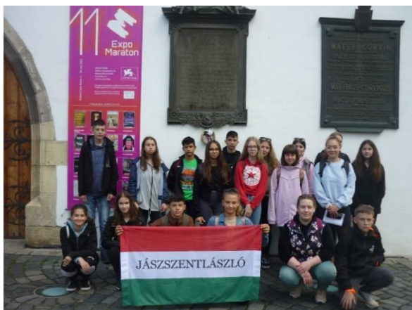
Kolozsváron Mátyás király szülőházánál