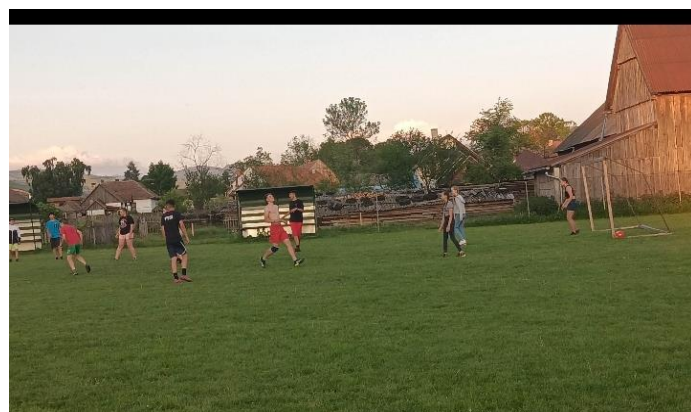
Focimeccs a gyergyószárhegyiekkel