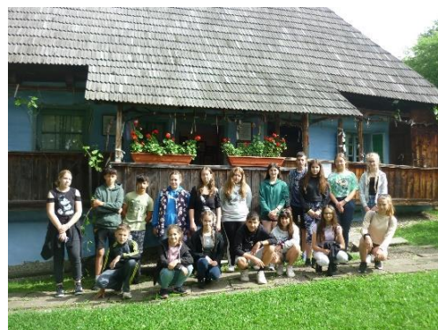
Az író szülőházánál