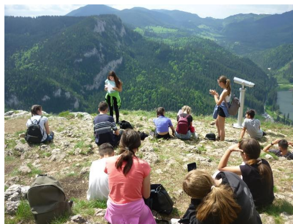
A Kis-Cohárd tetején