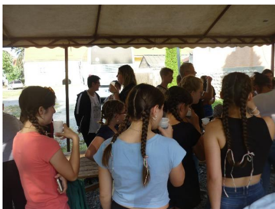
Piknik a helyiekkel