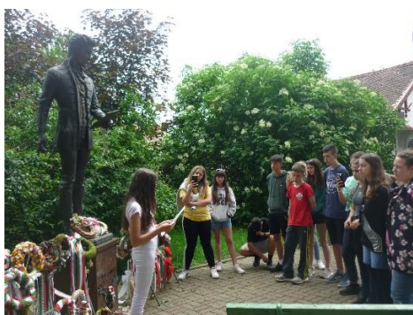
Fehéregyházán a Petőfi szobornál