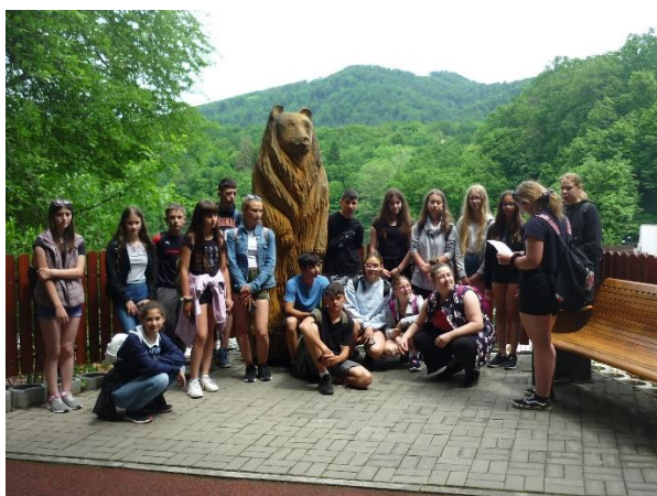
Előadás a Medve-tónál

A reggeli órákban látogatást tettünk a néprajzi múzeumban, majd indultunk tovább Szovátra a Medve-tóhoz, sétáltunk a tó körül. Tanulói kiselőadást hallgathattunk meg a tó kialakulásáról. Parajdra kellett volna mennünk, túráztunk volna a sókanyonban, de az eső miatt ez az elem nem valósult meg. A következő program Gyergyószárhegyen – a testvértelepülésünkön volt. A Nemzeti Összetartozás Napját ünnepeltük meg testvériskolánk, a Gyergyószárhegyi Bethlen Gábor Általános Iskola hetedikeseivel. A műsorban elhangzott a magyar Himnusz, egy beszéd, egy ének, Juhász Gyula: Trianon című verse, a hetedikesek tánca, végül a székely himnuszt énekeltük el. Majd ismerkedési piknik következett, gyorsan megtalálták a közös hangot diákjaink a gyergyószárhegyiekkel. Mi pedig a helyi pedagógusokkal beszélgettünk. A program a foci pályán folytatódott, a diákok egy nagyot fociztak. A napot ismét naplórással zártuk.