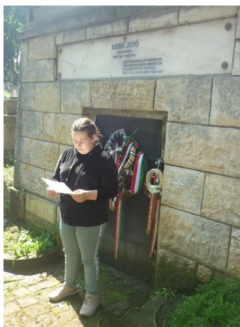
Előadás Dsida Jenő sírja előtt