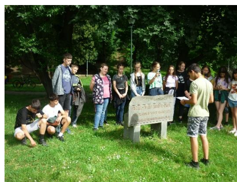
Nagyszebenben a Petőfi Sándor parkban