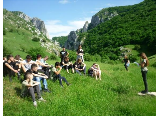
Előadás a Tordai-hasadékban