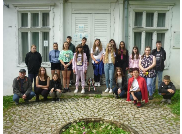
Csucsán az Ady-emlékház előtt