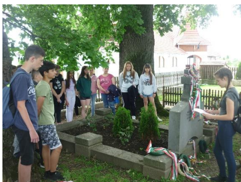
Tamási Áron sírjánál Farkaslakán

Reggel Farkaslakára indultunk, Tamási Áron sírhelyét tekintettük meg. Tanulói kiselőadás formájában ismerkedtünk meg Tamási Áron életének legfontosabb állomásaival. A tanulók koszorút helyeztek a síremléken, majd a sír gondozása következett. Az író szülőházát is meglátogattuk. Majd Fehéregyházára mentünk, ahol a Petőfi Emlékhelyet kerestük fel. A segesvári csata legfontosabb mozzanatait terepasztal segítségével tanári előadás formájában hallgathatták meg a tanulók. Ezután az emlékhely kertjének rendezése következett, majd a Petőfi-szobor megkoszorúzására került sor. A parkban található emlékműre is koszorú került. A következő utazási célpont Segesvár volt. Sétáltunk a várban, tanári kiselőadás formájában röviden felvázoltam a vár történetét. Nagyszebenben a Petőfi Sándor-parkban, ahol a költő Az Erdélyi hadsereg című tanulói vers tanulói felolvasása következett. Ezután Vízaknára mentünk. A feltételezett csatahely helyén egy tó áll, aminek környezete elhanyagolt. Tanulói kiselőadásban meghallgattuk Petőfi Sándor: Négy nap döngött az ágyú című versét. Majd Alvincra, a szállásra utaztunk, ahol a diákok rögzítették a nap fontos eseményeit.